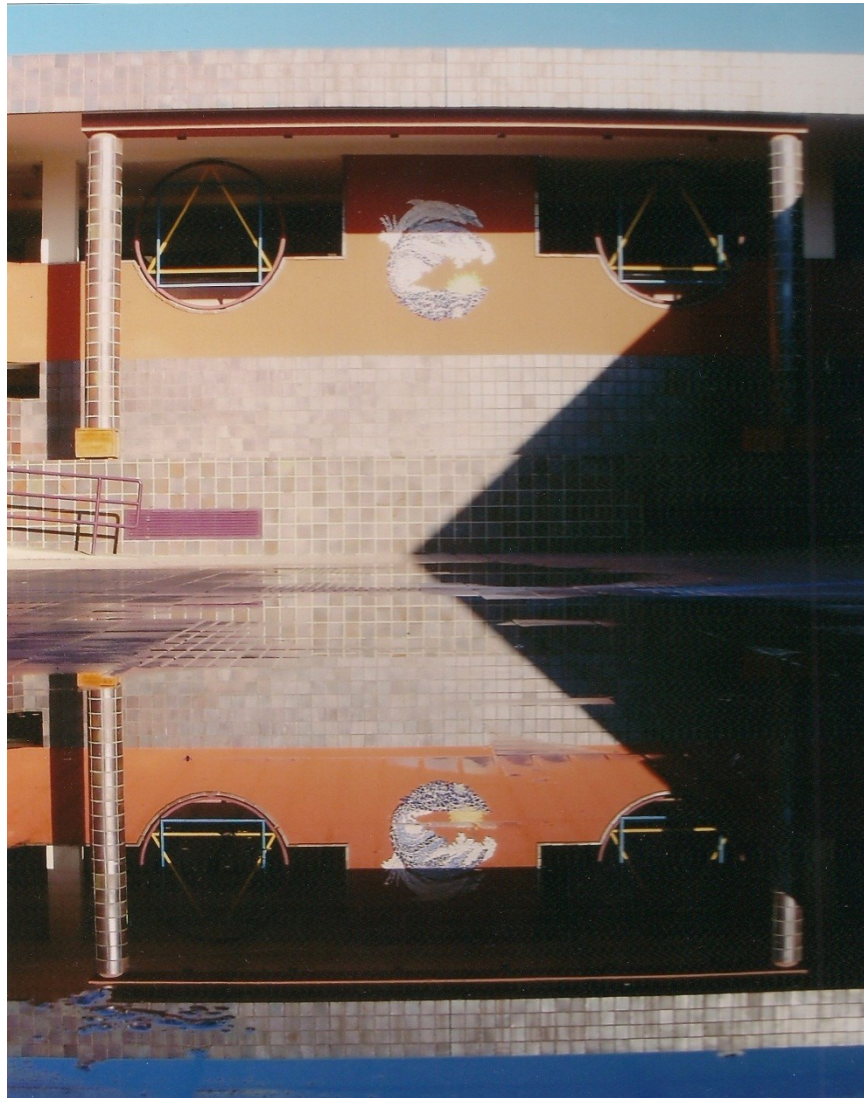
“Reflexión con cinco triángulos”

Autor: Salvador Domínguez Gil IES El Calero. Telde. Gran Canaria