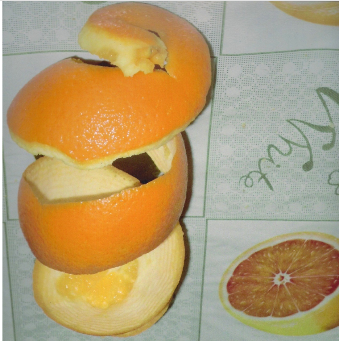
“La merienda de Arquímedes”