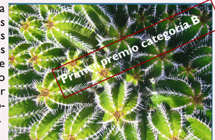
La curva. Aula Enclave. IES Playa Honda. Lanzarote