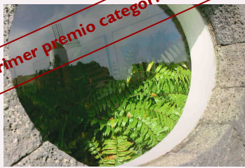
2pir. Aula Enclave. IES Playa Honda. Lanzarote

Popularmente, los aniversarios que son múltiplos de cinco suelen tener una relevancia especial. Y lo decimos porque esta es ¡¡nada menos!! que la convocatoria número 20, sí, el XX aniversario del concurso de Fotografía y Matemáticas. ¿Por qué hemos llegado hasta aquí? pues gracias a dos cosas principalmente: a la participa-